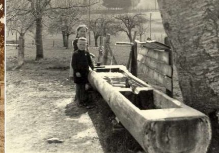
à la fontaine devant la maison

L'exploitation a brûlé en 1992 et a été reconstruite en une année. L'annexe du côté sud a été épargnée, y compris l'entrée de la grange.