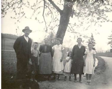
Famille propriétaire vers 1920

Cordiale bienvenue à Dürrenberg, une ancienne ferme sur le Längenberg, située entre Berne et Thoune.