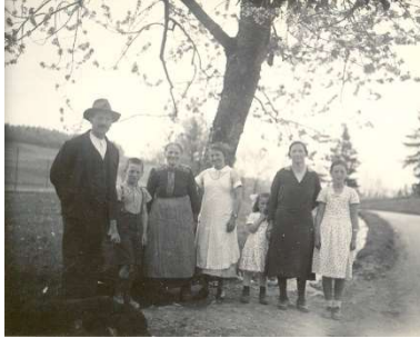
Besitzerfamilie um 1920

Wir heissen Sie/Dich herzlich willkommen im 'Dürrenberg', einem ehemaligen Bauerngut auf dem Längenberg zwischen Bern und Thun.