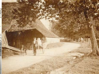
auf dem Weg in die Käserei