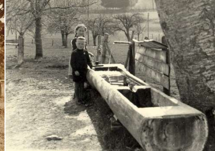
am Brunnen vor dem Haus

1992 fiel der Hof einem Brand zum Opfer. Innert eines Jahres wurde das Gebäude im Stil eines Bauernhauses neu erstellt. Die Nebengebäude auf der Südseite blieben erhalten, darunter der Ansatz der Tenneinfahrt.